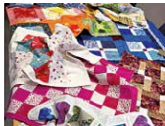
Till vänster: Pyttetäcken från alla grupper överlämnades till Sunderbyns sjukhus i oktober 2023. Till höger: Några av årets pyttetäck- en, som överlämnades den 2 januari i år.

tyger, kviltade och fodrade med flanell. Tillsammans med andra kviltgrupper har vi samlats och överlämnat våra pyttetäcken, som sen delas ut till prematurbarn på sjukhuset.