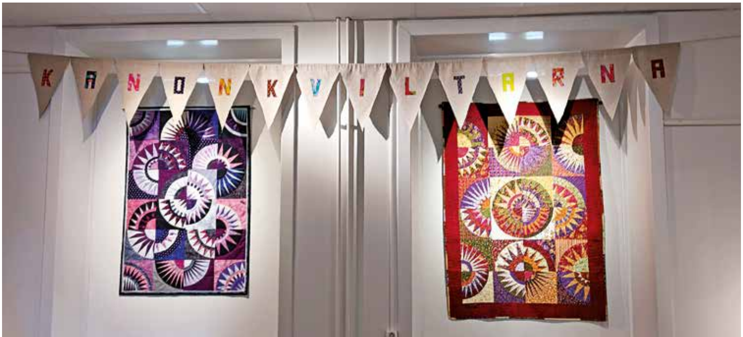
Kanonkviltarnas utställning på Försvarsmuseum i Boden pågick 21 mars–10 maj. Här är några av de verk som visades upp.

En utmaning? Eller kanske bara en trevlig fikaträff? Ta några bilder, skriv ihop ett par rader och skicka till: redaktoren@rikstacket.se