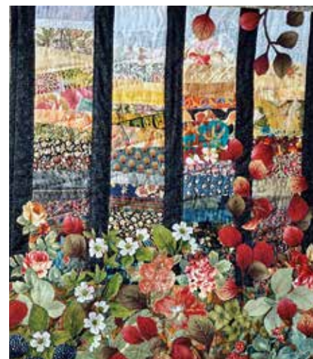
Ett av Anna-Gretas alster som blivit färdigt: Staketet från 2018-

Här nedan kan du läsa brevet i dess helhet, om det sedan ska ses som inspiration eller en varning är upp till dig!