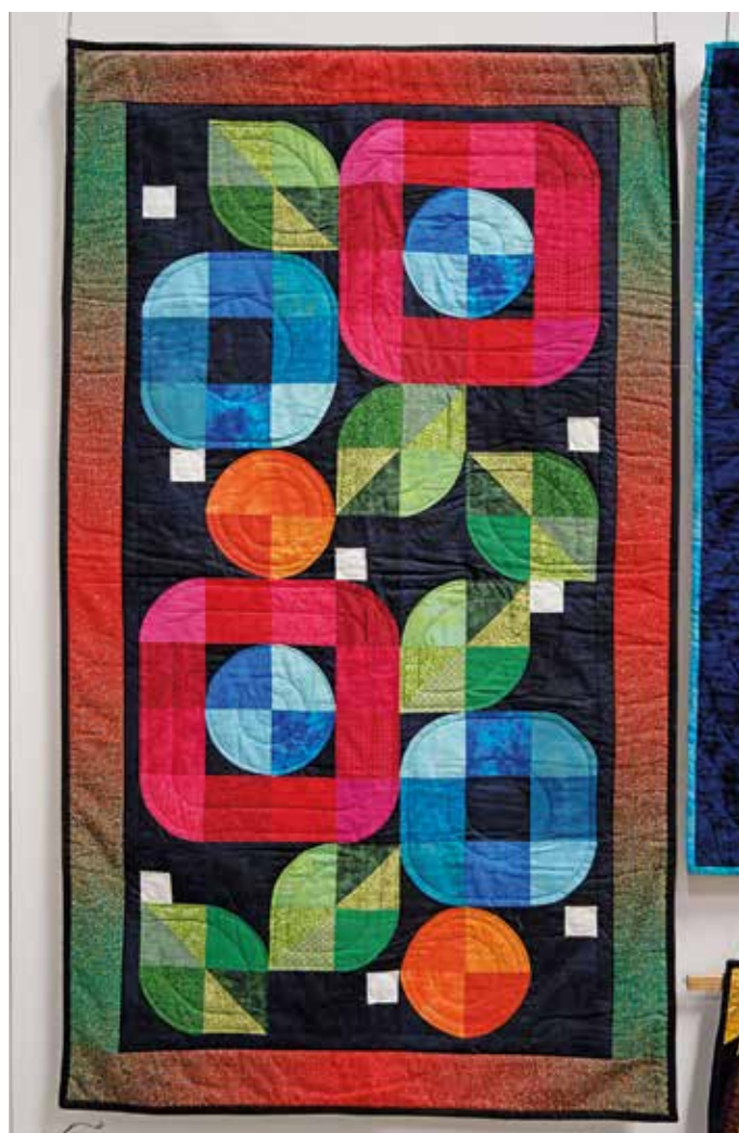
Fantasi Blommor av Norunn Wernhult.