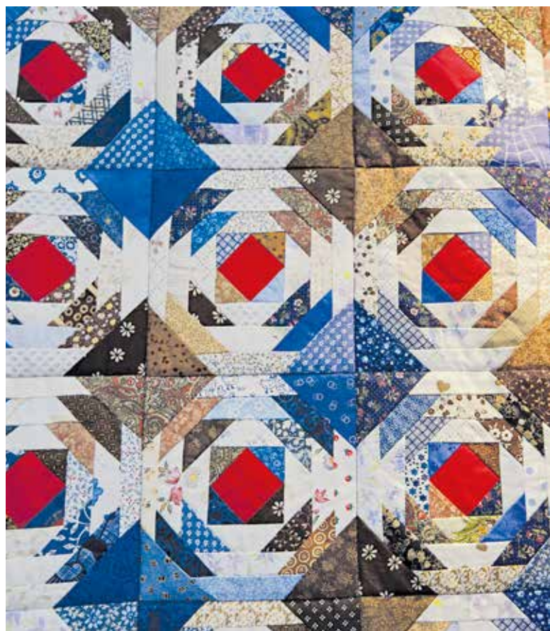
Ananas (detalj) av Anna-Lisa Olsson.