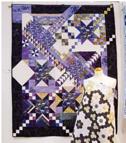
På väggen: Vinterfrost av Ulla Kjellberg.