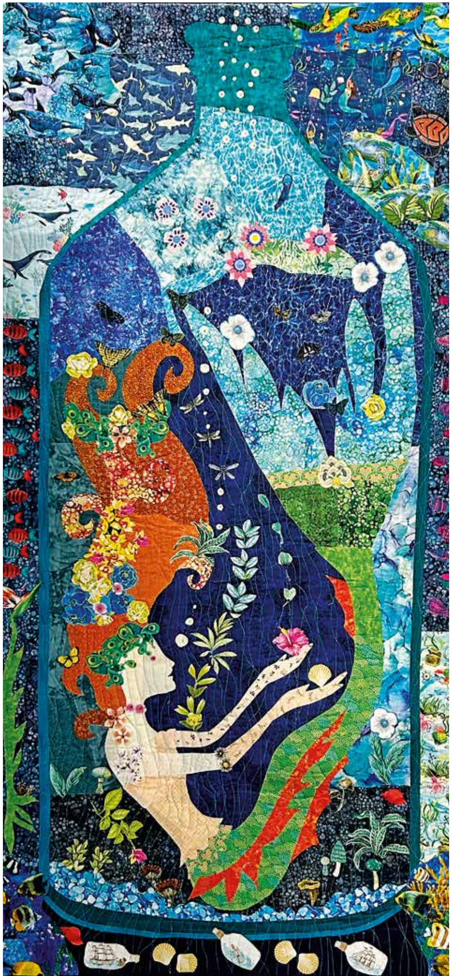
Sjöjungfru i flaska, av Kerstin Bergman.