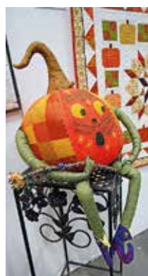
Häftig pumpa i höstmontern.

Genom samarbetet med Syfestivalen lockades, förutom många kviltare, även besökare som inte tidigare kände till lappteknik att titta in. Här visar vi ett litet axplock från utställningen.