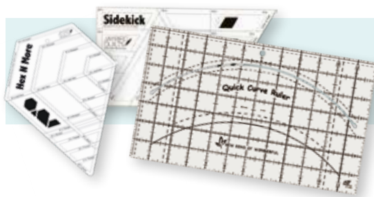
Några av favoritlinjalerna.

främst är det frihandskviltning men de allra största täckena lämnar hon till dem som har long arm-maskiner.