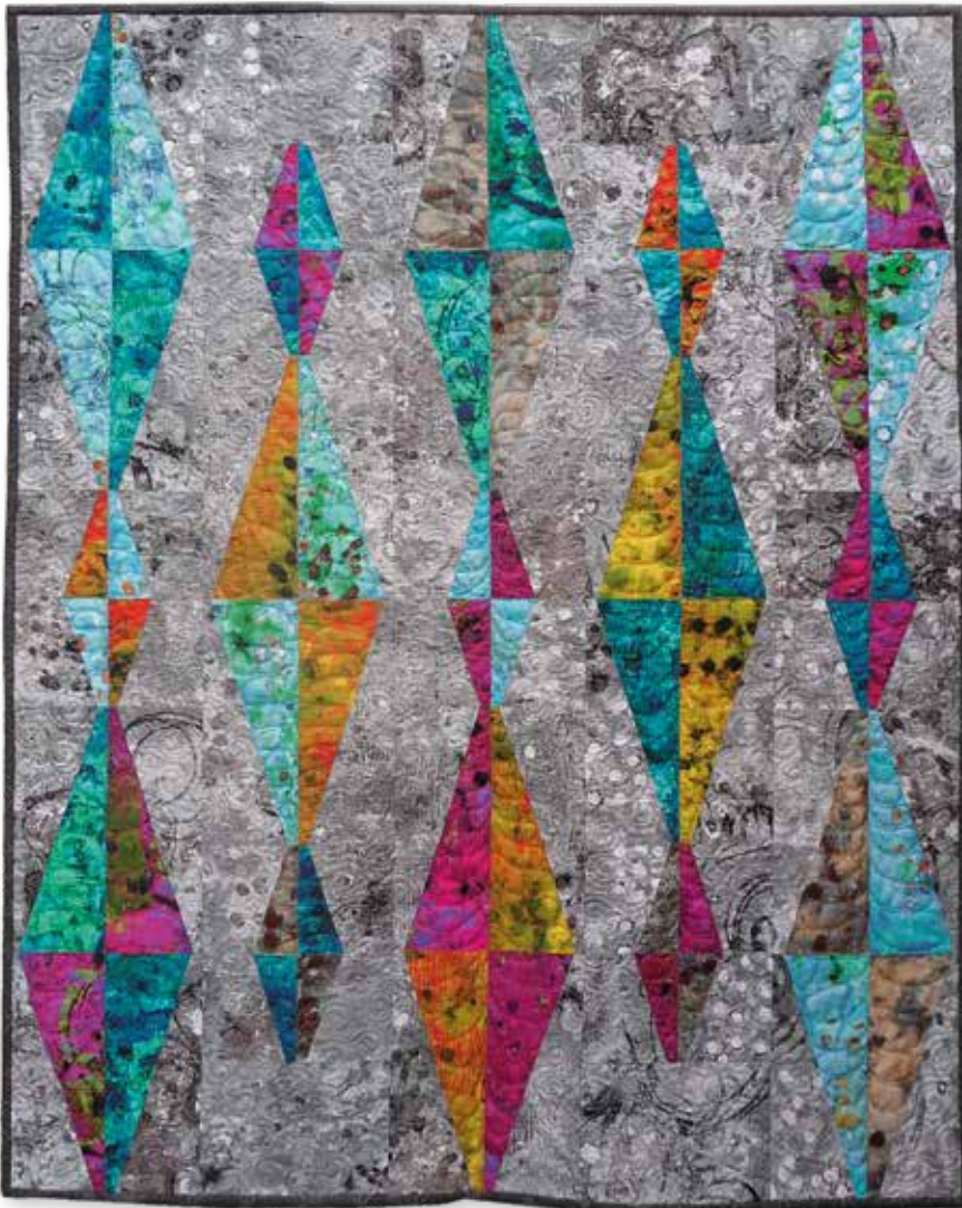
Kvilt gjord med hjälp av Quick Straight ruler. Detta är den senaste Karin gjort.