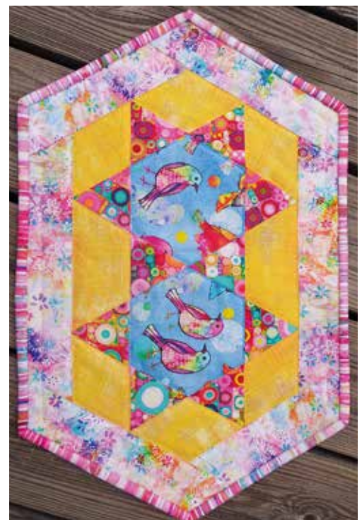
Tabletter med HexNMore och Sidekick.

där Pinterest är den stora inspirationskällan, men det är också tygerna som är stora bidragsgivare till den slutliga produkten. Favoritfärgerna är turkos, grönt och orange i klara nyanser.