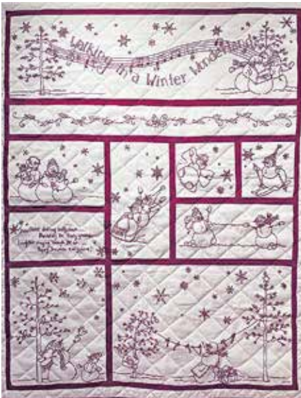
Vinterlandskap, Ulla Söderstedt