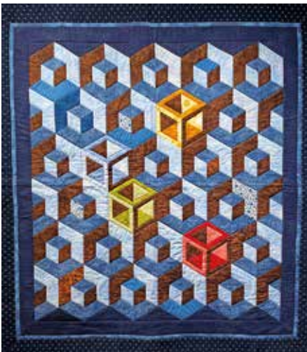
Kub i kvadrat, Carina Look.