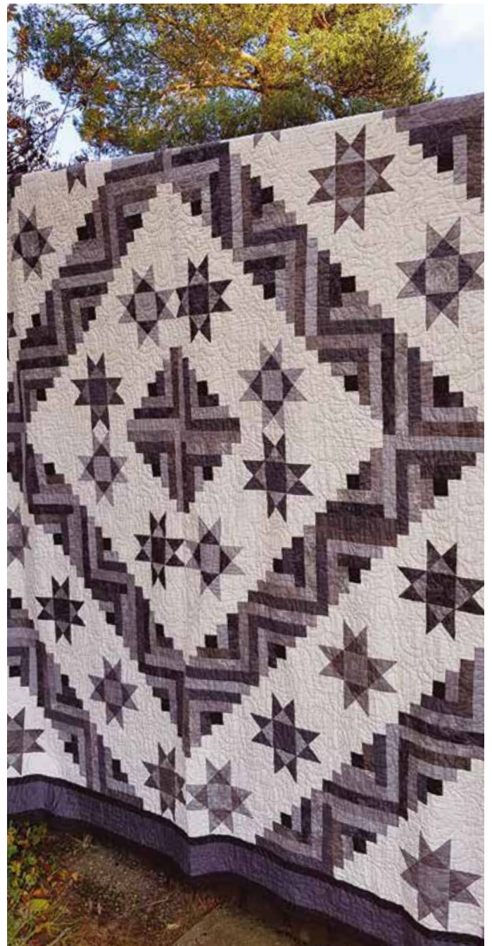
”Stora Grå” kombinerar Log cabin och stjärnor.

Det som revolutionerade lapptäcksömnaden var rullkniven, linjalen och skärmattan. De kom till Sverige 1987–1988, och Ally-Marie använde sig av dem när hon sydde ett barntäcke till sin son med blocken Hidden Wells. I samband med det vill Ally-Marie gärna framhålla en bok som Ica-förlaget gav ut 1988 av Kirsten Vistnes och Grete Gulliksen Moe, Lapptäcken på nytt och enkelt sätt . Den boken kan man fortfarande hitta på Bokbörsen och Tradera.