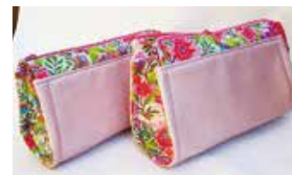
Necessär, mönster av Pink Pony.