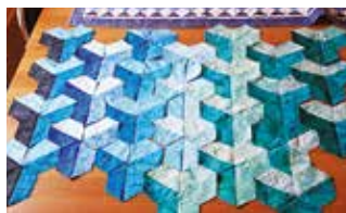
Kurs i Y-teknik.