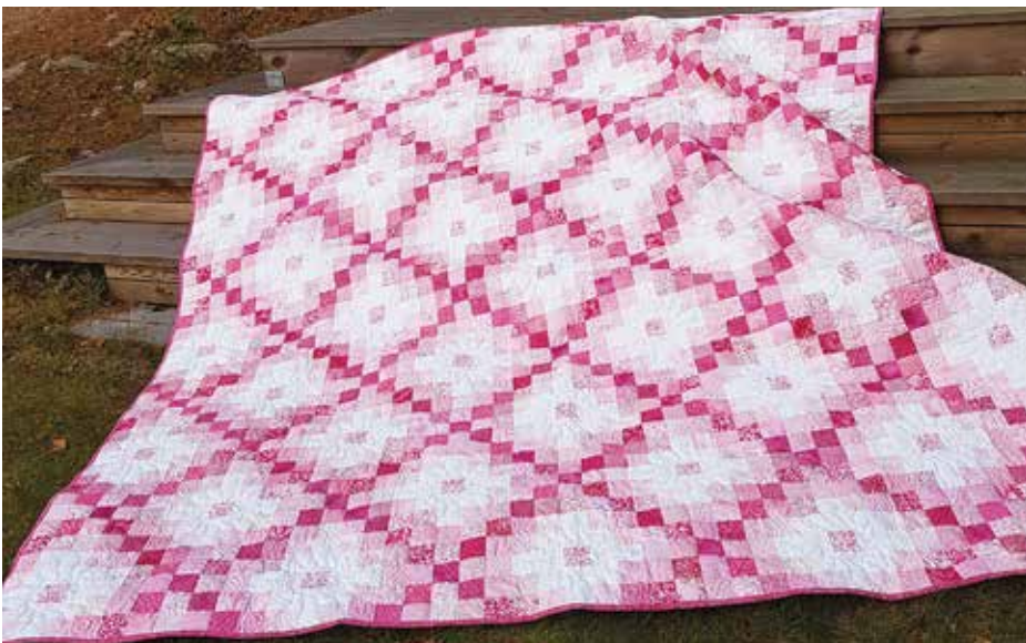
Triple Irish Chain innehåller ett fyrtiotal rosa tyger. Till vänster det färdiga täcket och till höger tygerna det består av.