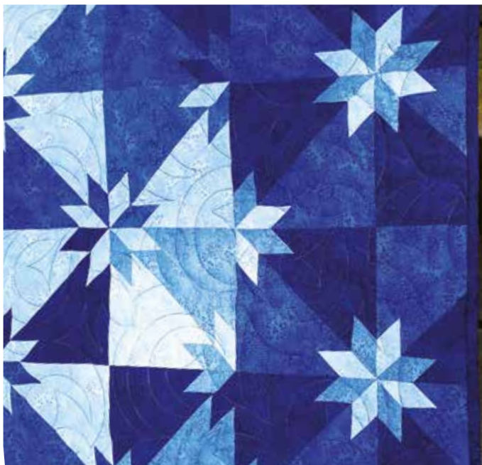
Detalj av Hunter Star-täcket. Notera de hela stjärnorna i kanten.

log cabin på en kurs 1979, men det blev inte riktigt en log cabin. Täcket i vitt, ljusgrönt och rosa, som hon kallar ”Trädgårdstäcket”, saknar avslutningskant och är vändsytt. Man kan nog säga att den kursen var inte helt lyckad.