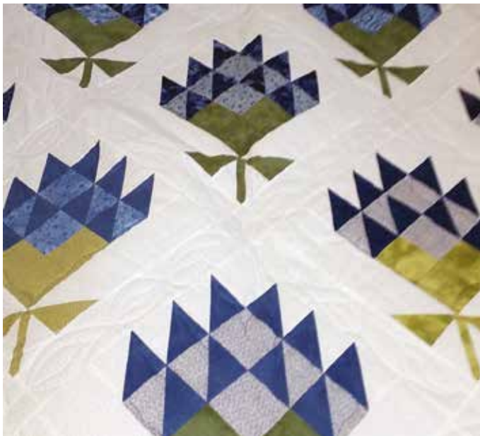
”Klöverblommor”, Ally-Maries första frihandskviltning med longarm.