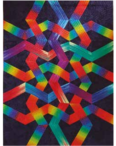
Night Weave-täcket, sytt med x-blocklinjal.