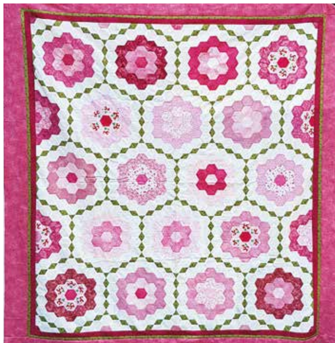
"Mormors trädgård", handsydd kvilttopp.

Förutom sömnad av allehanda slag, tycker Ally-Marie om att laga mat, baka och att umgås med vänner och med sin stora familj.