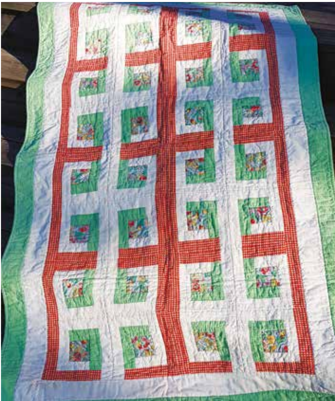
"Trädgårdstäcket", en inte helt lyckad Log cabin.