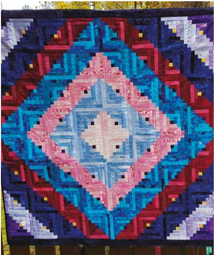
En lite rimligare Log cabin, "Solnedgång i skärgården".