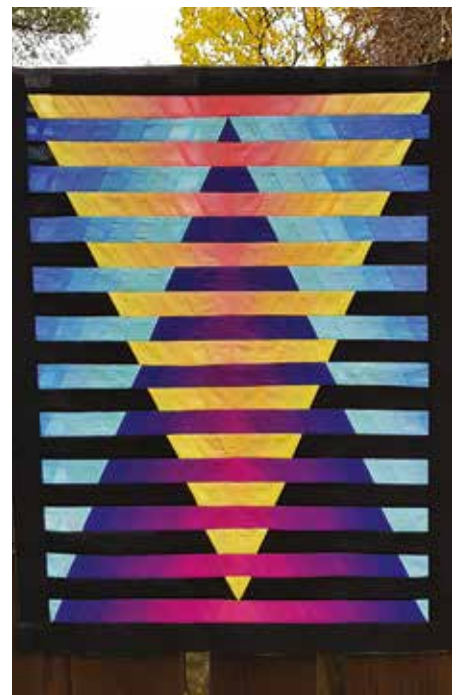
Randigt och färgstarkt.