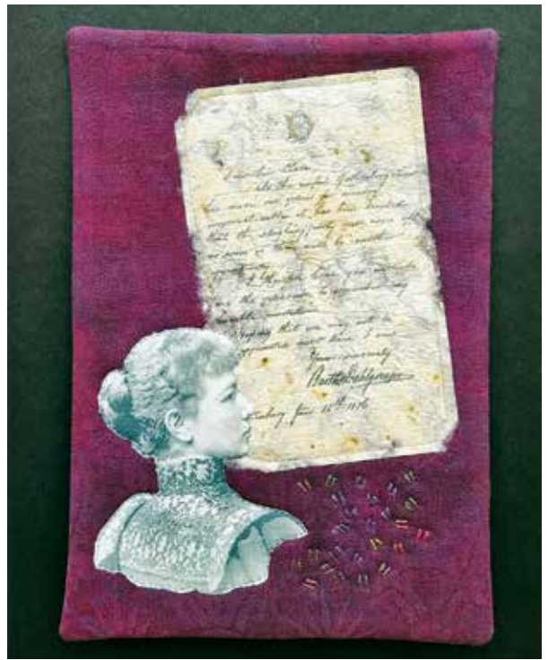
"Clara", 2017. Linnedamast och bomullsbatist.