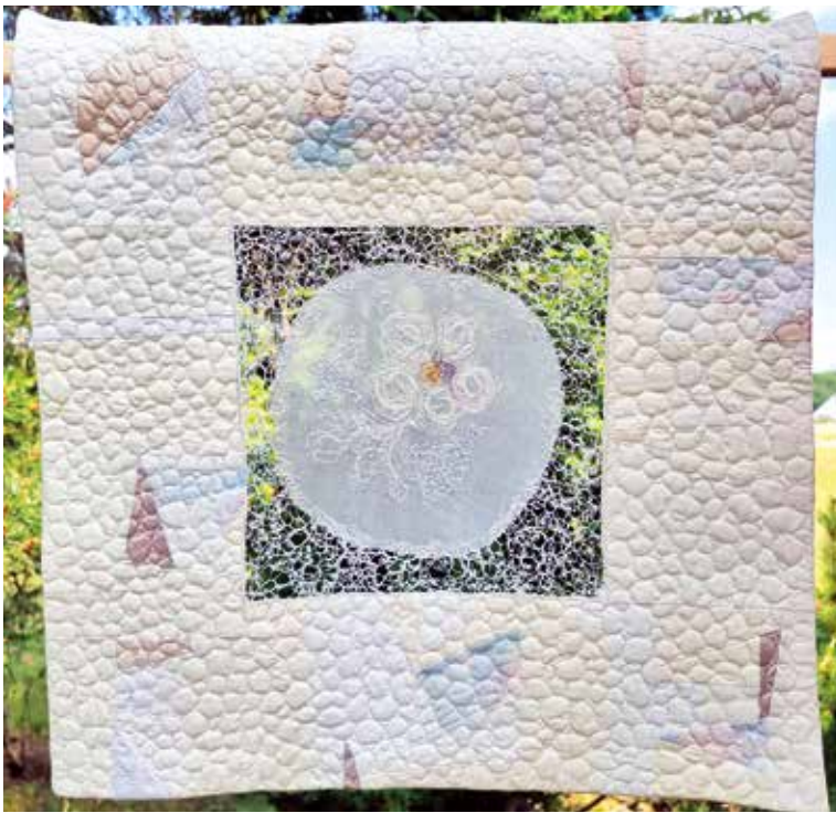
"Window Quilt", 2011. Sidenorganza och lingarn.