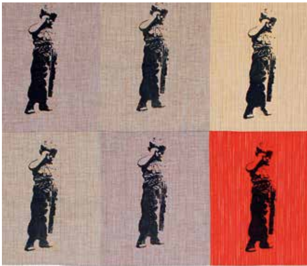
”Lasse liten”, 2020, samt fotografiet som var förlaga.