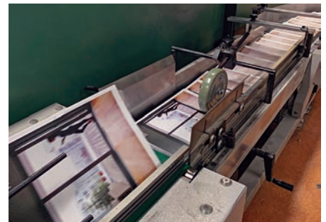
Buntarna förses med omslag och limmas eller häftas. Sedan skärs kanterna av.