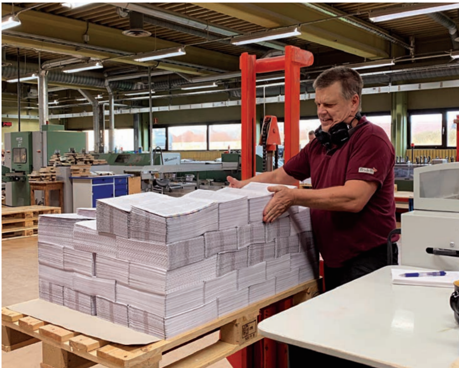
En av tryckeriarbetarna på Trydells buntar ihop de vikta arken och flyttar dem till en annan maskin, där de sorteras så att varje exemplar av tidningen får rätt sidor i sig.