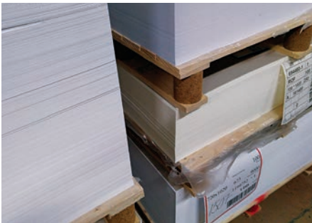
Pappret som används till Riksticket kommer från Grycksbo i Dalarna.