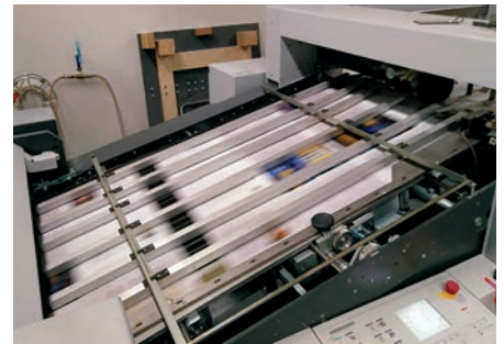
De tryckta arken viks i en maskin.