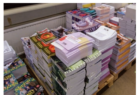
Färdiga tidningar, redo att skickas iväg till läsare.