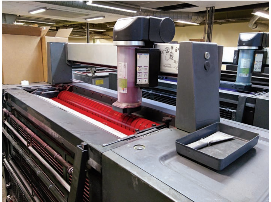
I tryckpressen används fyra färger för att åter skapa alla andra färger. Här syns magenta-valsens, och i bakgrunden skymtar den blå cyan-valsens.