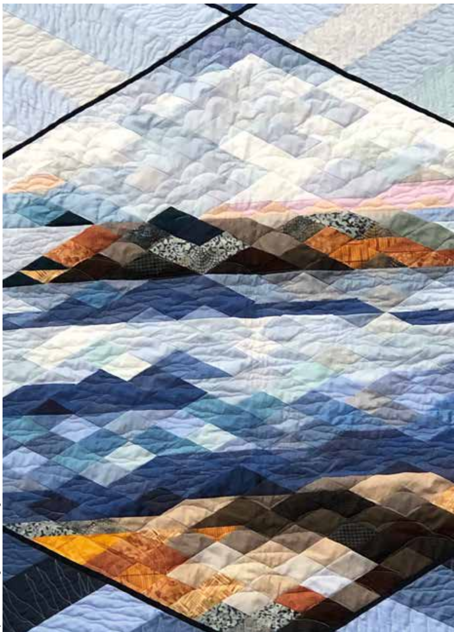
Sytt och fotograferat av Birgit Bernander